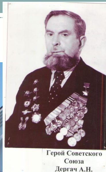
Герой Советского Союза Дергач А.Н.

25 января 2017 года школе присвоили имя героя СССР Дергача А.Н.