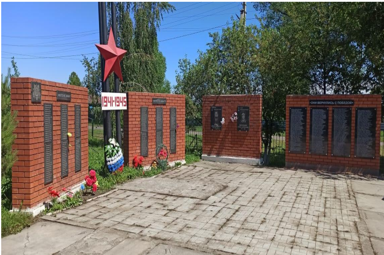
Памятник воинам, погибшим в годы Великой Отечественной Войны