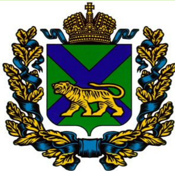
«Парадный» герб Приморского края