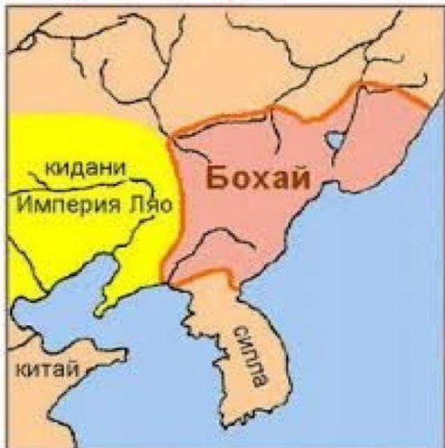
Карта государства Бохай